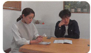
人の行動のメカニズム