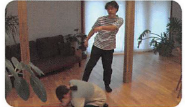
加害者のゆがんだ認知