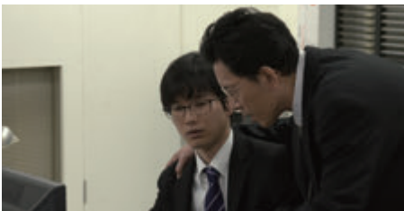
パワハラ事例4 過大な要求