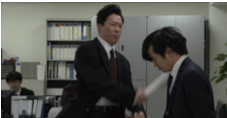
パワハラ事例1 身体的攻撃