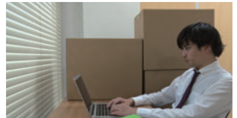
パワハラ事例3 人間関係からの切り離し