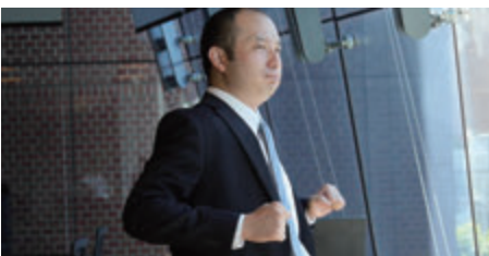
4 アンガーマネジメント